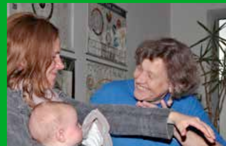
Lernen mit dem Muskeltest und viel Bewegung