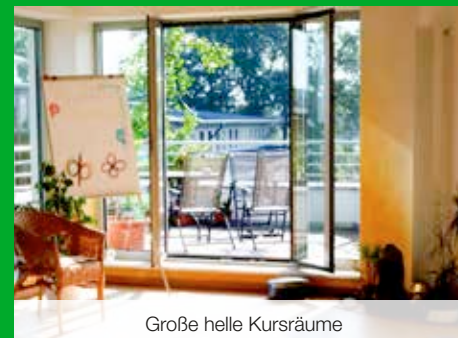
Große helle Kursräume