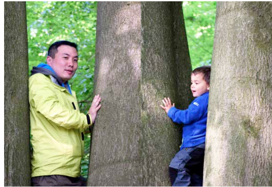
Blicke mit Freude und Neugier auf deine frühe Kindheit