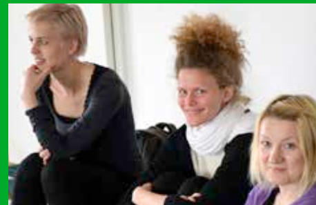
Treffpunkt für Menschen jeder Berufung