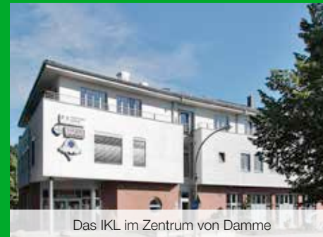
Das IKL im Zentrum von Damme

Erhalte hier das Wissen und den Erfahrungsschatz der Entwicklungskinesiologie aus erster Hand.