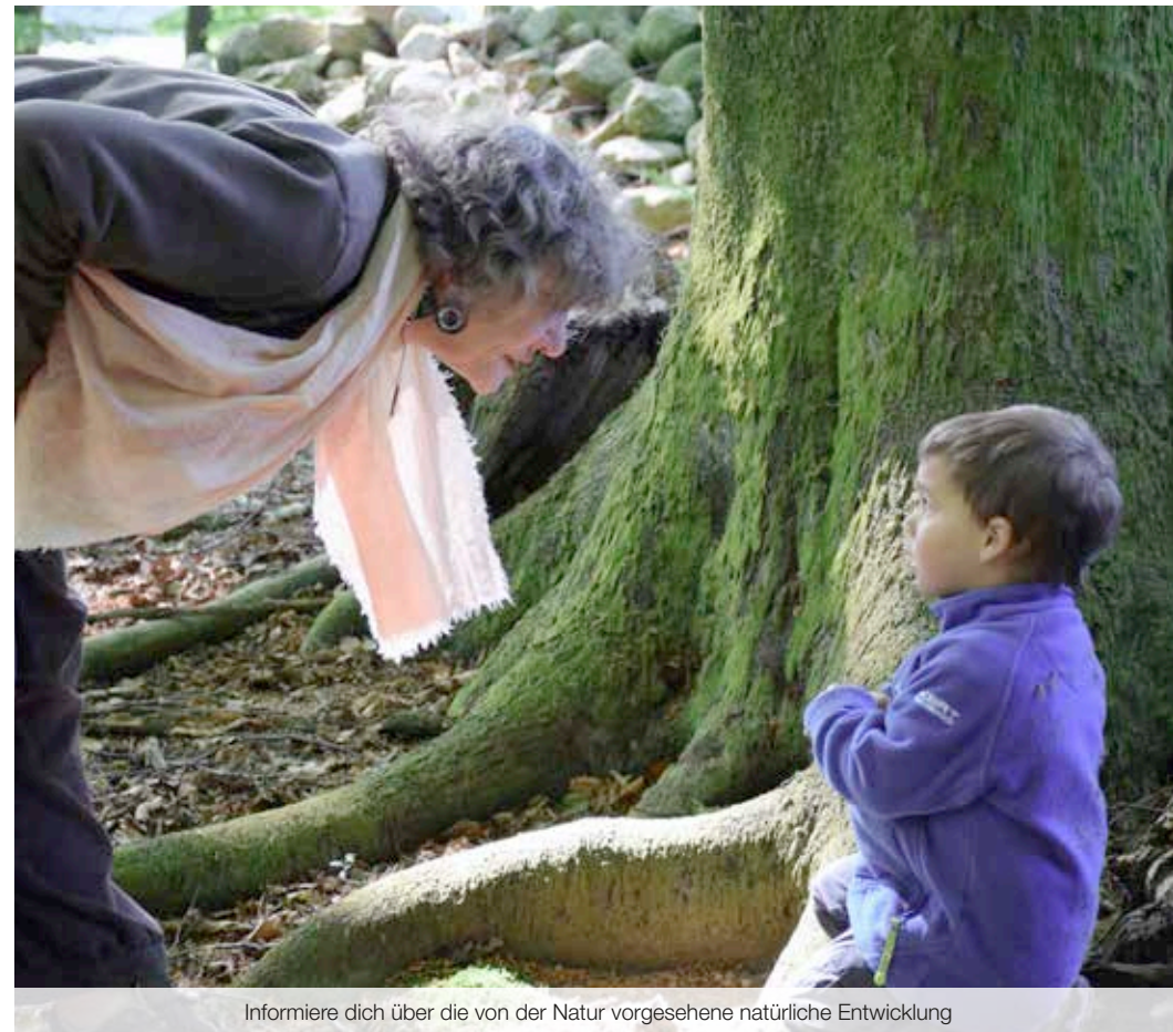
Informiere dich über die von der Natur vorgesehene natürliche Entwicklung

Seit 1996 ist die Entwicklungskinesiologie anerkannter Zweig der Educational Kinesiology Foundation. Damit gelten die Kurse in Deutschland und auch international als Fortbildungen für Brain Gym®-Instruktoren. Alle Entwicklungskinesiologiekurse sind anerkannte Ausbildungskurse des